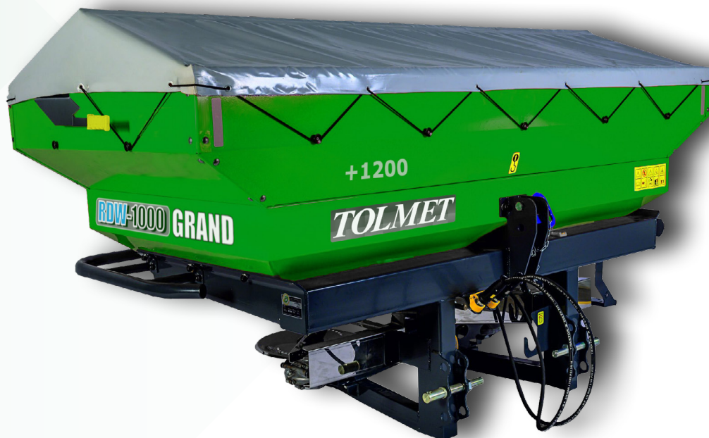
Rozsiewacz RDW-1000 GRAND z nadstawką 1200 L

Pojemność zbiornika: 2200 litrów Masa: 390 kg Prędkość robocza: do 13 km/h Typ dozownika: szczelinowy Mechanizm rozrzucający: tarczowy Średnica tarczy: 445 mm Liczba tarcz: 2 Liczba noży na tarczy: 2 Napęd: WOM Szerokość robocza: 16-30 m