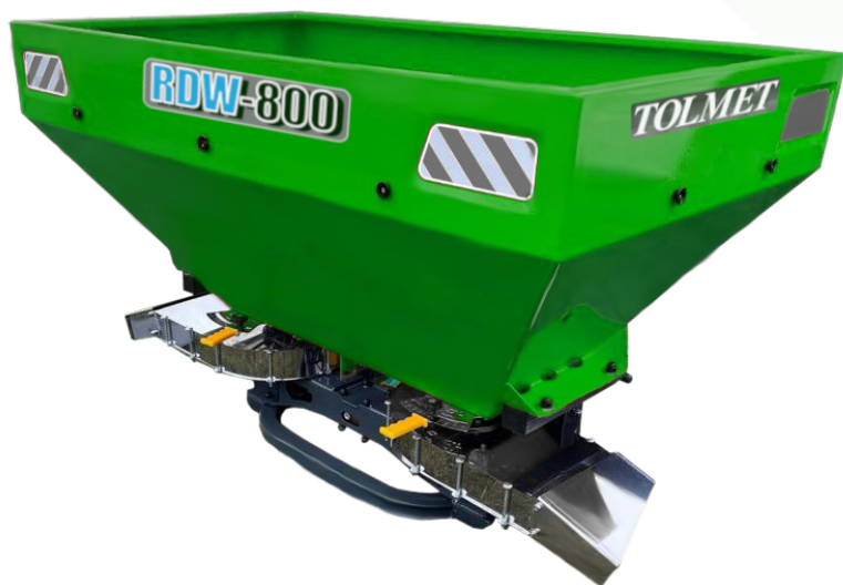
Rozsiewacz RDW-800 z przystawką sadowniczą

Nasz rozsiewacz nawozów mineralnych został zaprojektowany z myślą o efektywnym i precyzyjnym rozprowadzaniu nawozów granulowanych. Dzięki regulowanemu dozownikowi, nawóz z zasobnika trafia na tarcze rozsiewające, które rozrzucają go równomiernie na określonym obszarze. Intensywność aplikacji można łatwo dostosować za pomocą dźwigni, co pozwala na pełną kontrolę nad dawkowaniem nawozu.